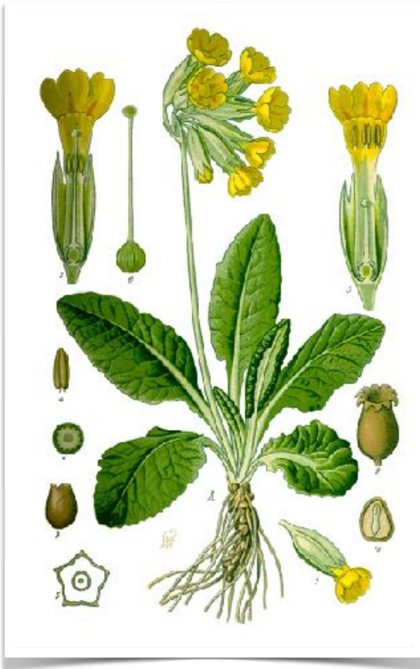
Planche botanique de la primevère officinale